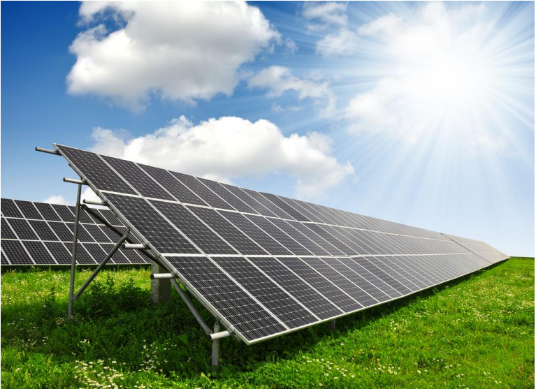
E alguma vontade de melhorar o mundo